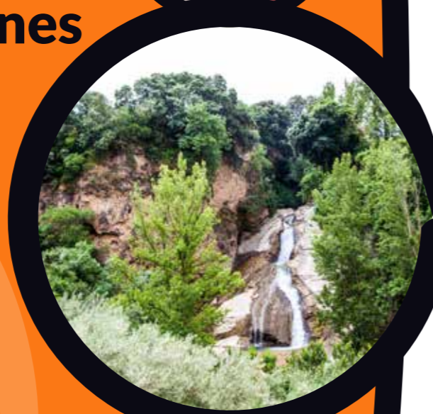
Salto del Caballo