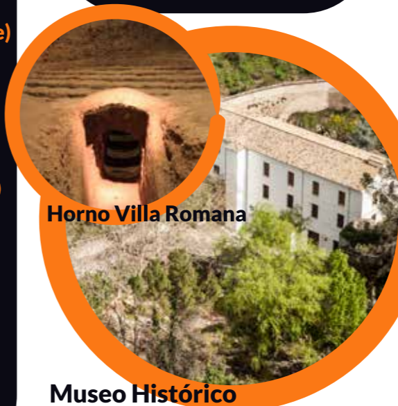
Horno Villa Romana